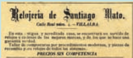
Anuncio publicado en El Eco de Vilalba, 1910.