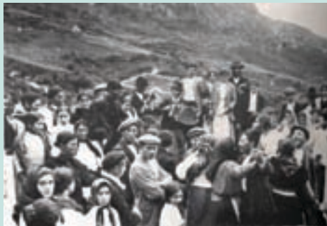
Romeiros bailando o agarradiño.